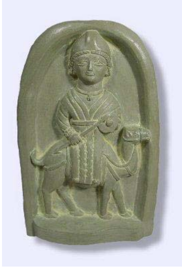
اللات الالهة الانثى اله القمر الام الكبرى في الطائف